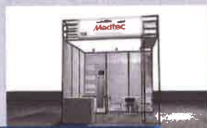
エレガントパッケージ

バビリオンブース・スペシャルデザインブースについては、お問い合わせください。 その他の備品は、お申込後にオプション備品 (有料) として追加可能です。