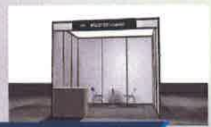
スタンダードパッケージ