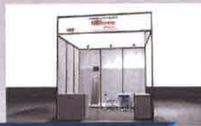
アップグレードパッケージ