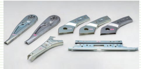
超ハイテン研究開発製品

▷超ハイテン研究開発成果により、現在超ハイテン1.2GPaまでの量産加工を実現。また、今後の更なる高硬度化を視野に入れ、超ハイテン1.2GPa/1.5GPaの研究開発を継続的に行い、次世代自動車の軽量化に貢献します。